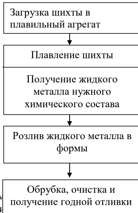
Рисунок 1 – Схема получения отливок. Массу отливки, литейные отходы определяют опытно-производственным методом. При этом количество одновременно взвешиваемых деталей зависит от массы каждой детали.

Особенности нормирования расхода материалов для литейного производства машиностроительных предприятий связаны с его четырёхфазным характером (рисунок 1).