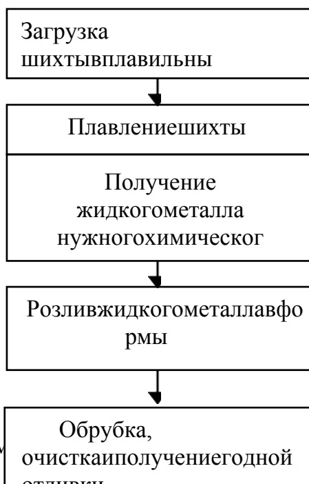
Рисунок 1 – Схема получения отливок

Особенности нормирования расхода материалов для литейного производства машиностроительных предприятий связаны с его четырёхфазным характером (рисунок 1).