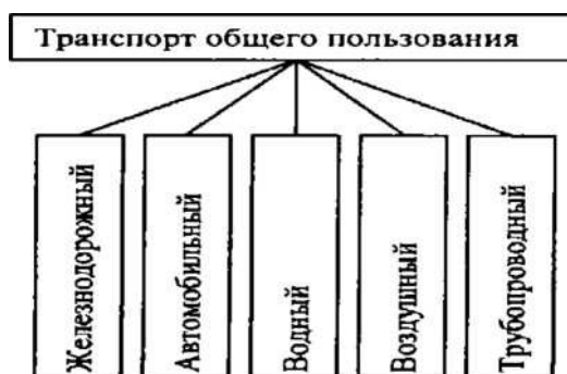
Рисунок 1 - Виды транспорта общего пользования

Транспорт общего пользования — отрасль народного хозяйства, которая удовлетворяет потребности всех отраслей народного хозяйства и населения в перевозках грузов и пассажиров. Транспорт общего пользования обслуживает сферу обращения и население. Его часто называют магистральным (магистраль — основная, главная линия в какой-нибудь системе, в данном случае — в системе путей сообщения). Понятие транспорта общего пользования охватывает железнодорожный транспорт, водный транспорт (морской и речной), автомобильный, воздушный транспорт и транспорт трубопроводный (рис. 1)